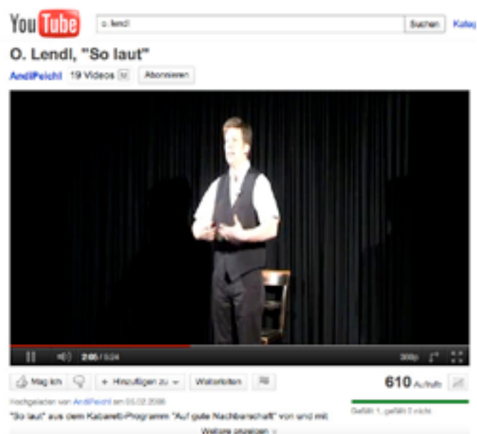
LINK ZU VIDEO 3