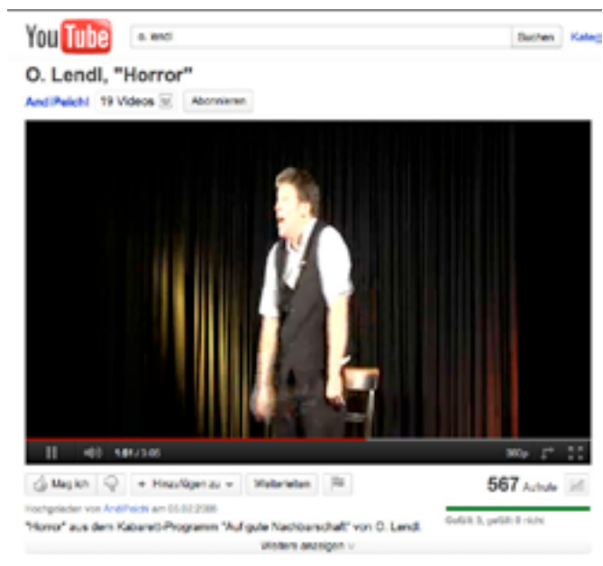
LINK ZU VIDEO 2