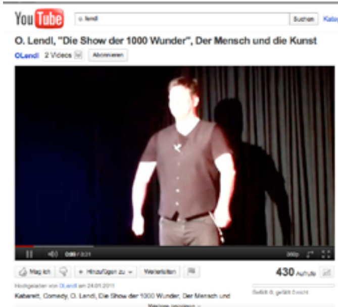
LINK ZU VIDEO 4