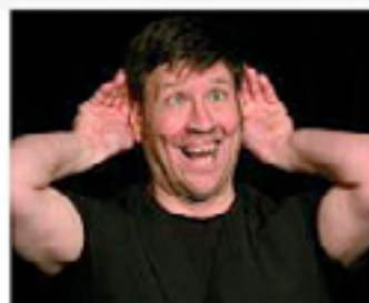
O. Lendl liefert eine Show zum Wundern.