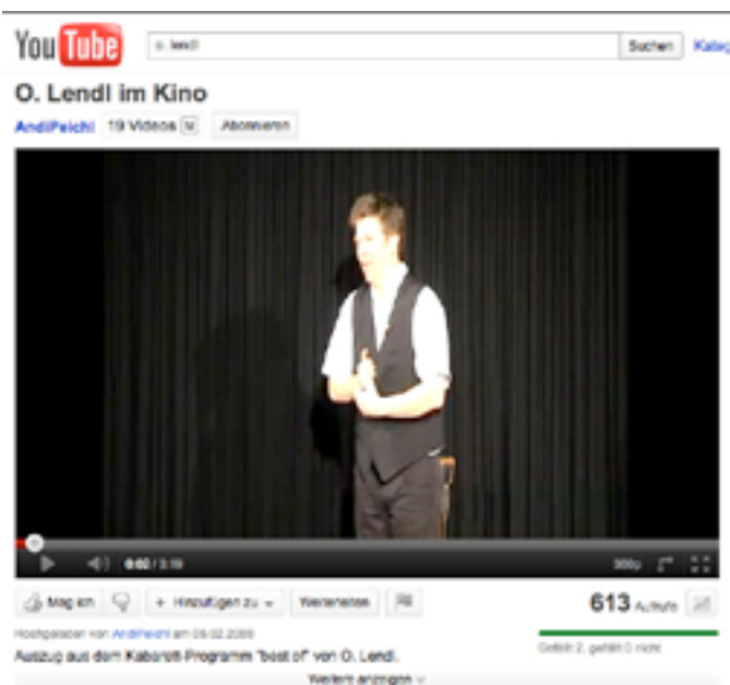
LINK ZU VIDEO 1